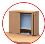
Stauraum für Tastatur und Maus