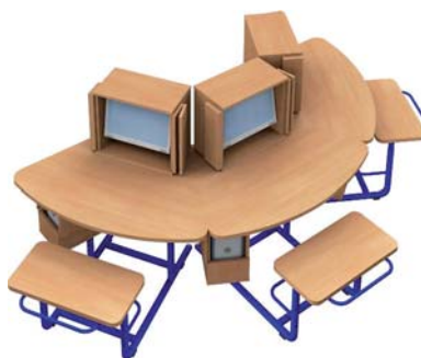
Sitz und Fußstange nach Größenklassen höhenverstellbar