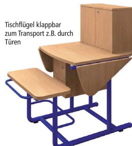
Tischflügel klappbar zum Transport z.B. durch Türen

Die einzelnen Lerninseln können wie Tortenstücke aneinandergestellt und miteinander fixiert werden, sodass mit 6 Lerninseln ein Kreis gebildet wird. 3 Lerninseln bilden dementsprechend einen Halbkreis.