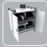
LapCabby mini 32V